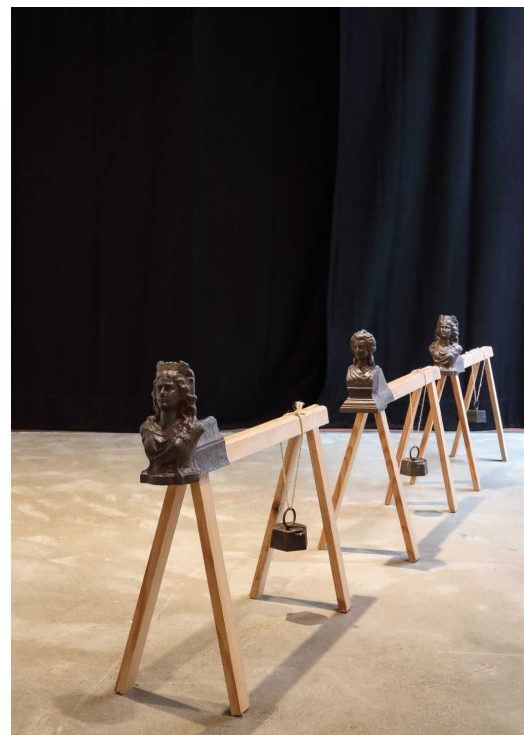
L.E.F. , 2020 Installation, technique mixte : tréteaux, poids, chenets. Dimensions variables. © Rémi Boinot

Manipulateur de signes et d'images, Rémi Boinot, emprunte tant dans les cultures occidentales qu'asiatiques ou africaines. Par Une œuvre