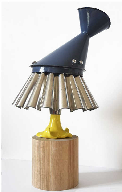
Fig. , 2021 47 x 23 cm, bois, métal, céramique, aimants. Rémi Boinot