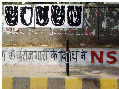
Affichage sauvage , Kotla, Inde, 2004.