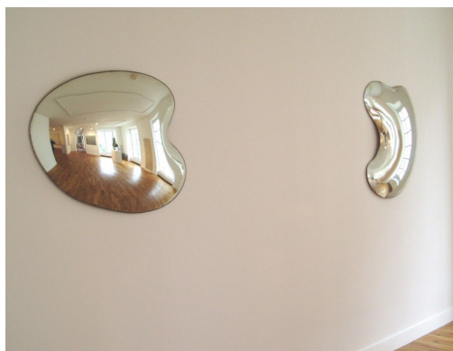
Deux points de vue , verre thermoformé, découpé et argenté, 2005. Commande publique, © Collection Musée des Beaux-Arts, Tours

Sculpteur qui se tient à l'écart des courants dominants, il occupe une place particulière et atypique sur la scène contemporaine française et internationale. Dès ses débuts dans les années 1960-70, marqué par un désir de prolifération, son travail s'organise en cycles souvent laissés volontairement incomplets sur lesquels il revient quelquefois des années après ; il expérimente en permanence des processus qui font naître des formes qu'il n'a cessé de développer. Il se sert de l'histoire de la sculpture et des techniques qui y sont associées pour contextualiser ses travaux, réunis sous forme d'installations, d'accumulations, voire d'hybridations.