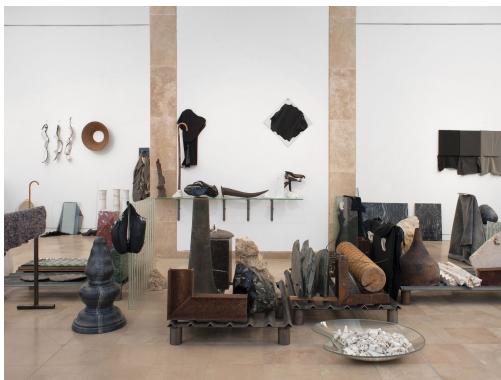
Déposition , 2017. © Peter Briggs Vue de l'exposition « Brouillon Général #2 », Musée Saint-Roch, Issoudun, 2017. Photographie de © Musée Saint-Roch