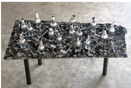
Empty Vessels, verre soufflé argenté et bâtons de verre, 2000-2001. Vue de l'exposition « Chiasma », La Coopérative, Centre d'Art et de Littérature, Montolieu, 2010.