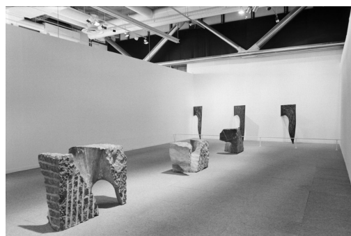
Vue de l'exposition « In Situ : 12 artistes pour les galeries contemporaines », Centre Georges Pompidou, 1982.