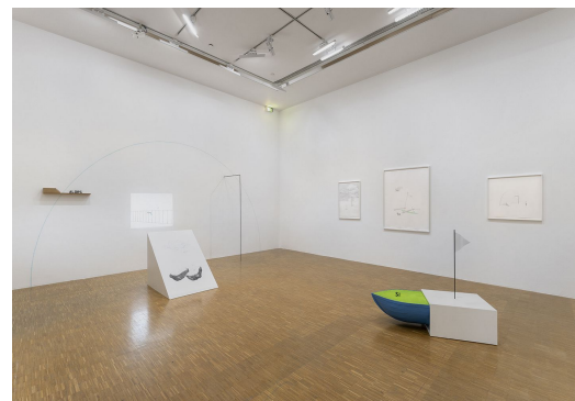
L'immensité de l'instant , 2023

© Massinissa Selmani et la Galerie Anne-Sarah Bénichou, Paris