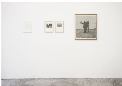
Vue des Altérables , projet initié en 2010

© Massinissa Selmani et la Galerie Anne-Sarah Bénichou, Paris