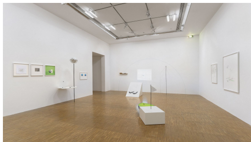
L'immensité de l'instant, 2023

Représenté·e par la Galerie Anne-Sarah Bénichou (Paris), et Selma Ferriani Gallery (Sidi Bou Saïd, Tunisie & Londres, Royaume-Uni)