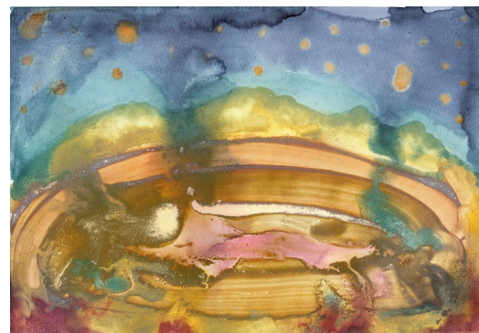
Paysage migratoire, 2021 Sang menstruel et pigments végétaux (baies de troène, phytolaque, peau d'oignon jaune, cassis) sur papier 30 x 21 cm © Laetitia Bourget