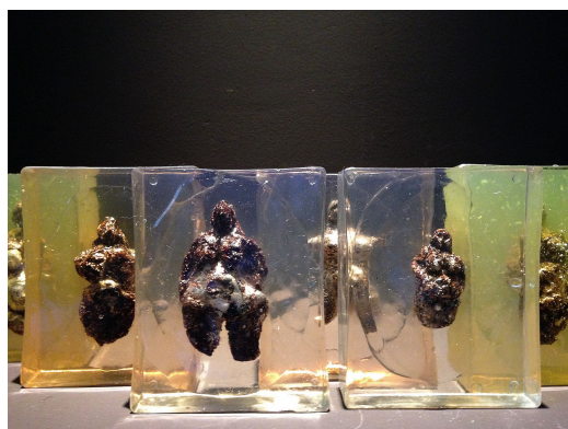
Sculptures excréments, 1997 à 2001 Inclusions d'excréments humains dans la résine polyester 8 x 10 x 3,5 cm © Laetitia Bourget

Plasticienne polyvalente, mes recherches m'amènent à m'initier sans cesse à de nouvelles pratiques, explorer la matière du vivant dans mes réalisations plastiques, et la matière de la vie dans mes textes.