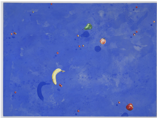
Salade de fruits, 1977 Acrylique sur toile, 200 x 149,5 cm