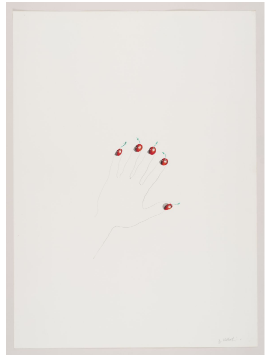
Ma main, 1975 Acrylique et graphite sur papier, 74,5 x 52 cm