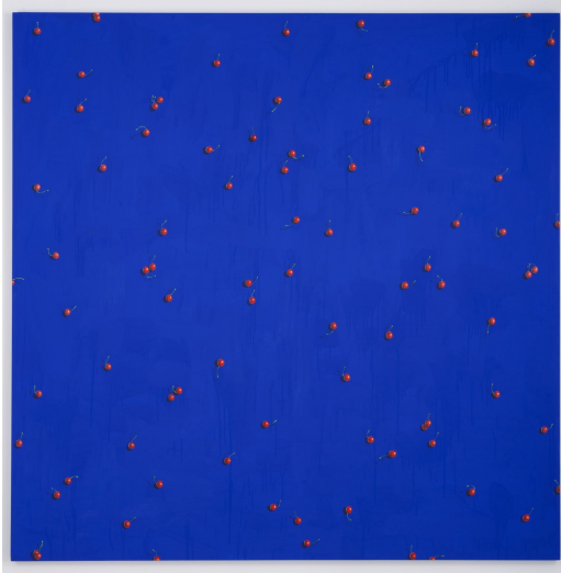
Peinture, 2008 Acrylique sur toile, 200 x 200 cm