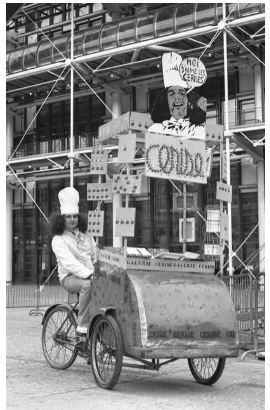
Galerie Cerise, 1976-1977 Différentes techniques