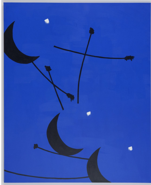
Cerises mécaniques , 2024 Acrylique sur toile de lin, 200 x 160 cm