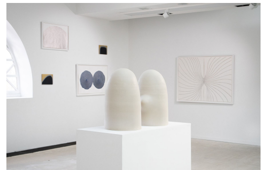
Vue de l'exposition collective Co-existences , Centre d'Art Contemporain l'Ar[T]senal, Dreux, 2025. © Elvira Voynarovska, ADAGP 2025

Elvira Voynarovska est une artiste franco-ukrainienne née à Kyiv. En 2019, elle est diplômée de l'ESAD Orléans. Une partie de son Master s'est déroulée entre la France et la Pologne, au sein de l'Académie des Beaux-Arts de Gdansk. Après l'obtention son diplôme, elle réalise un voyage