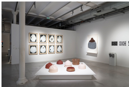
Installation de sculptures Architectures de terre , 2022 et de plusieurs dessins. Vue de l'exposition organisée au FRAC Centre-Val de Loire en 2023.