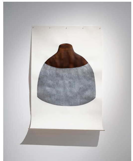
Installation de sculptures Architectures de terre , 2022 et de plusieurs dessins. Vue de l'exposition organisée au FRAC Centre-Val de Loire en 2023.