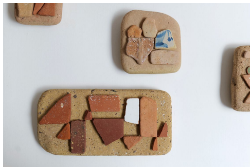
Painting with broken tiles, 2021 Installation de sculptures, Faïences, briques et céramiques récoltées dans la Méditerranée © Vincent Tuset-Anrès